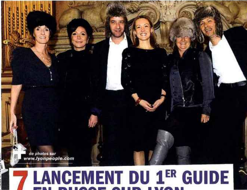
de photos sur www.lyonpeople.com

LES 20 RENDEZ-VOUS qu'il ne fallait pas rater